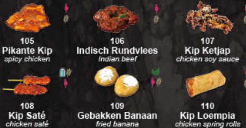
105 Pikante Kip 106 Indisch Rundvlees 107 Kip Ketjap 108 Kip Saté 109 Gebakken Banaan 110 Kip Loempia