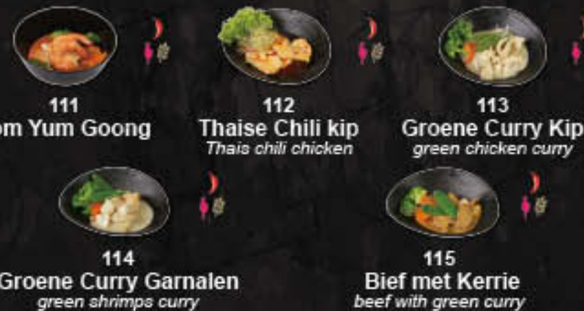
111 Tom Yum Goong 112 Thaise Chili kip 113 Groene Curry Kip 114 Groene Curry Garnalen 115 Bief met Kerrie