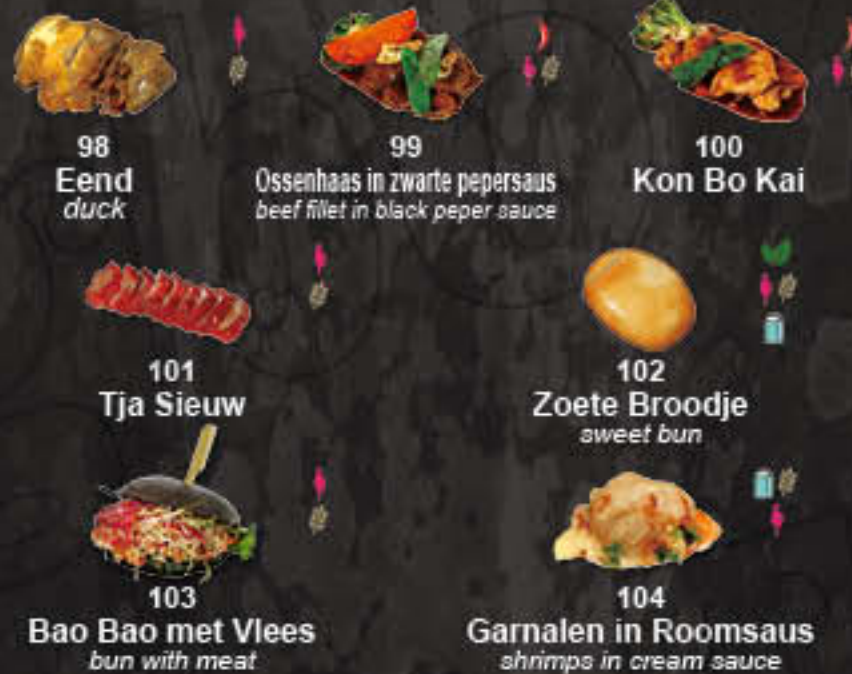
98 Eend 99 Ossenhaas in zwarte pepersaus 100 Kon Bo Kai 101 Tja Siew 102 Zoete Broodje 103 Bao Bao met Vlees 104 Garnalen in Roomsaus