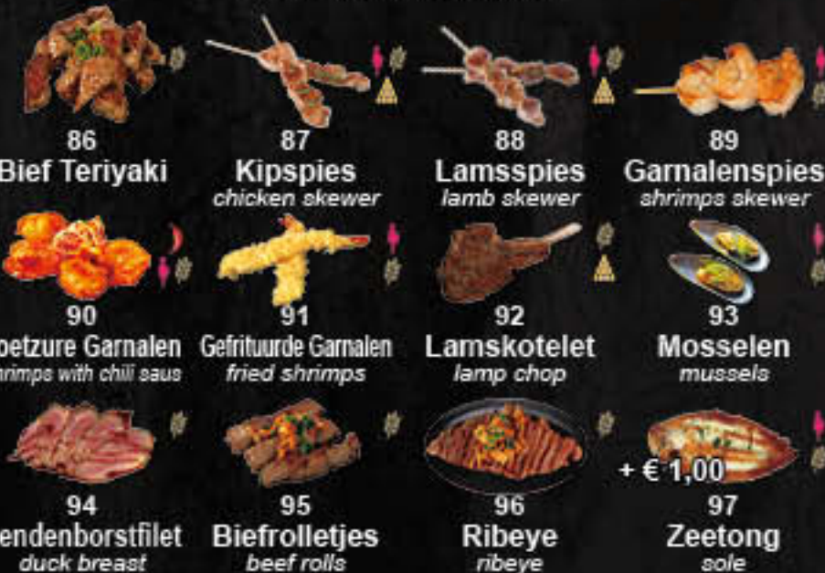
86 Bief Teriyaki 87 Kipspies 88 Lamsspies 89 Garnalenspies 90 Zoetzure Garnalen 91 Gefrituurde Garnalen 92 Lamskotelet 93 Mosselen 94 Eendenborstfilet 95 Biefrolletjes 96 Ribeye 97 Zeetong