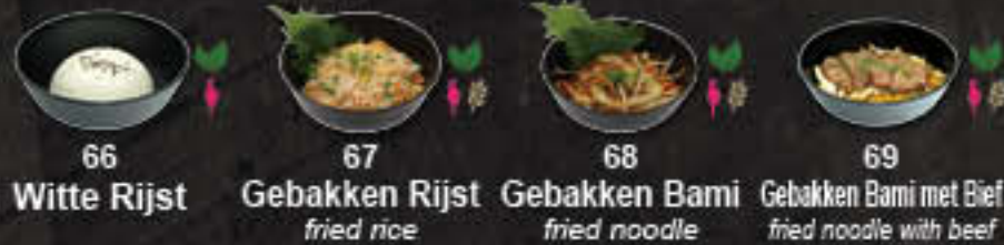
66 Witte Rijst 67 Gebakken Rijst 68 Gebakken Bami 69 Gebakken Bami met Bief