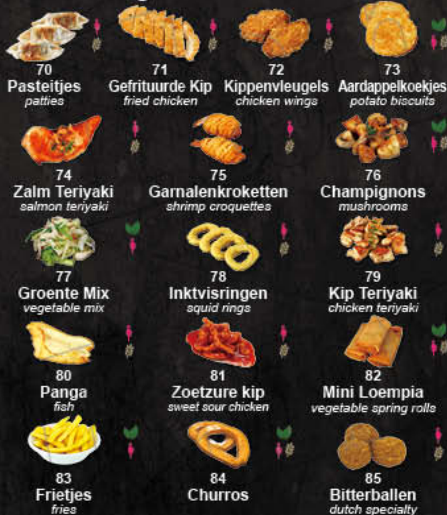
70 Pasteitjes 71 Gefrituurde Kip 72 Kippenvleugels 73 Aardappelkoekjes 74 Zalm Teriyaki 75 Garnalenkroketten 76 Champignons 77 Groente Mix 78 Inktvisringen 79 Kip Teriyaki 80 Panga 81 Zoetzure kip 82 Mini Loempia 83 Frietjes 84 Churros 85 Bitterballen